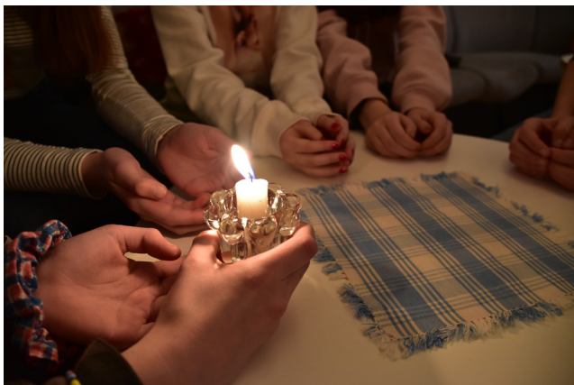
Andreasfreda' avslutas alltid med en ljusrunda.

När jag började var det ett uppdrag i anställningen att jobba med barn och ungdomsverksamhet. Andreasfreda' startades först och Ung kväll kom strax efter, då det fanns personer i de åldersgrupperna att utgå från. Tanken med verksamheterna är att skapa mötesplatser för olika åldersgrupper. Andreasfreda' är för lite yngre och det är som en fritidsklubb med mycket lek, men även prat. Vi börjar med att fika och sedan följer lek, bakning, pyssel eller liknande. Vi avslutar med en ljusrunda, en förenklad andakt där alla ska få utrymme att uttrycka sig. Jag vill att kyrkan ska vara en trygg plats där man kan känna sig hemma.