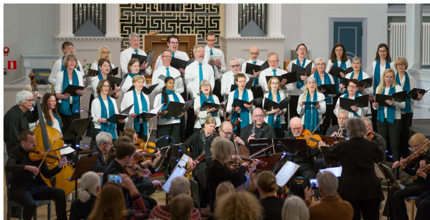
Con Spirito och Haninge Sinfonietta framför Vivaldis Gloria

Då reserestriktioner råder p.g.a. coronaviruset är resan till New York i juni inställd, men kommer förhoppningsvis genomföras vid ett senare tillfälle.