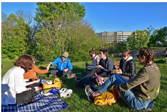
Avslutning med Alpha i Tantolunden

Tack, Alpha för alla roliga initiativ och idéer du har! Varje vecka händer något nytt, en ny lek eller ett nytt samtalsämne, det är alltid spännande. Trots att vi kommer trötta blir det alltid energiskt i lekarna och vi får även kraft till att ha meningsfulla samtal, samtal där vi får prata av oss och samtidigt fånga upp nya tankar och idéer.