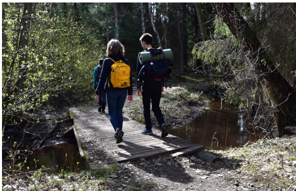
Vandring vid Lida friluftsområde på annandag påsk.

Fredag kväll. Inga fyllda tåg, pratande människor eller klapprande steg. Det är bara jag, hemma på mitt rum, fast ändå inte. På min skärm ser jag mina vänners ansikten, något hackiga kanske, men fortfarande där. Det är ingen vanlig Ung kväll i kyrkan, men vi hittar gemenskap över en skärm. Tillsammans pratar vi, skrattar, spelar spel och tänder ljus. Ett möte som i all sin enkelhet har en stor betydelse. Vi är långt från kyrkan och pingisbordet, långt från varandra, men samtidigt nära. Jag hade inte kunnat föreställa mig hur ett Skype-möte kan bli mycket mer. En möjlighet att prata av sig och bryta upp de mönster som kallas för den nya vardagen. Samtidigt finns en längtan efter mer. Skype-samtal i all sin ära, men det går fortfarande inte att jämföra med verkligheten.